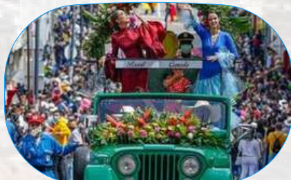
Feria de Manizales