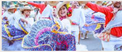
Fiestas de San Juan y San Pedro. Ibagué