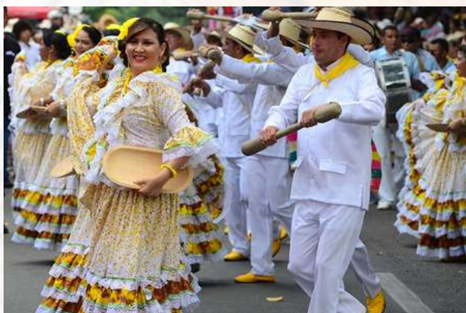
Festival Vallenato. Valledupar