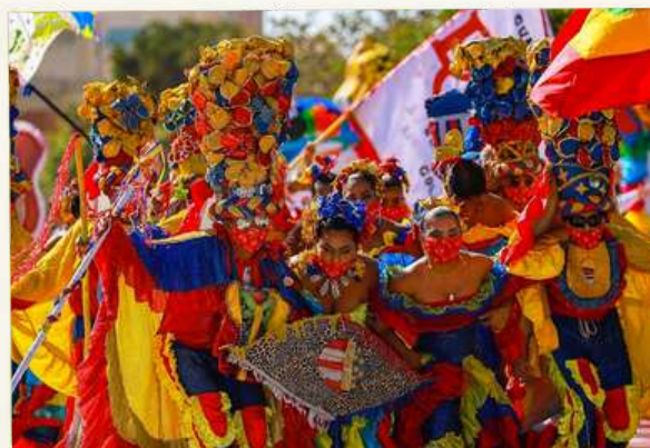
Carnaval de Barranquilla.

En julio y agosto se celebran en Colombia dos de las fechas que marcaron el inicio de la historia del país como nación independiente. Por tal motivo, en esta edición queremos hacer homenaje a Colombia y a los múltiples festejos culturales que se realizan en todo el país durante todo el año, los cuales resaltan la unión y las costumbres que nos identifican como nación. Los eventos organizados por la Embajada muestran la diversidad de nuestra cultura.