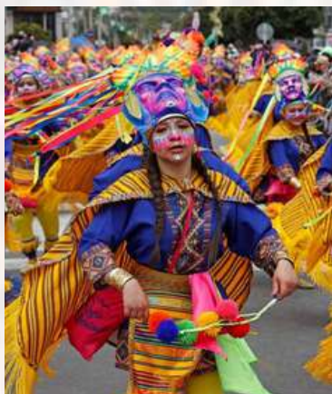
Carnaval de negros y blancos. Pasto