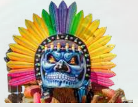
Carnaval de negros y blancos. Pasto