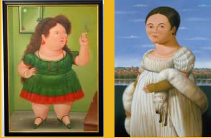
Rauchende Frau y Mademoiselle Rivière - Fernando Botero

El Leopold Museum presenta por primera vez una exquisita selección de obras de la Colección Würth, una de las colecciones privadas más grandes de Europa. De las más de 20.000 obras de la colección, fueron seleccionadas varias obras del renombrado artista colombiano Fernando Botero.