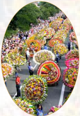
Feria de las Flores, Medellín